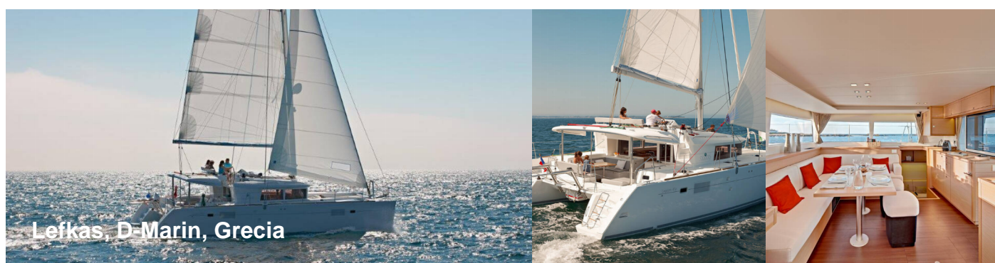
Lefkas, D-Marin, Grecia