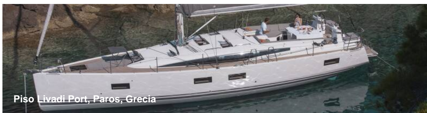
Piso Livadi Port, Paros, Grecia