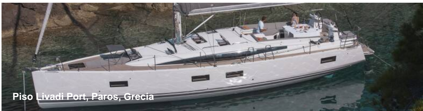
Piso Livadi Port, Paros, Grecia