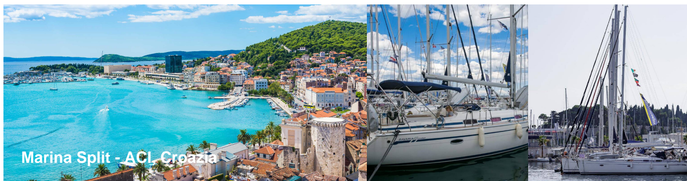
Marina Split - ACI Croazia