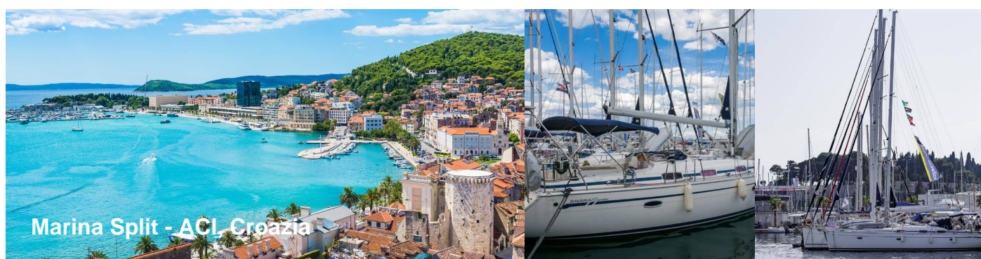
Marina Split - ACI, Croazia