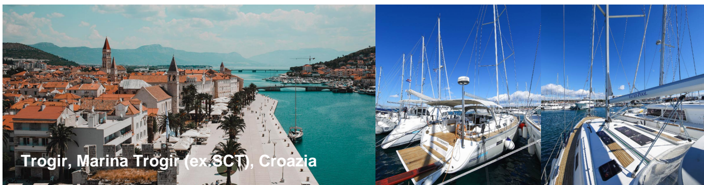
Trogir, Marina Trogir (ex SCT), Croazia