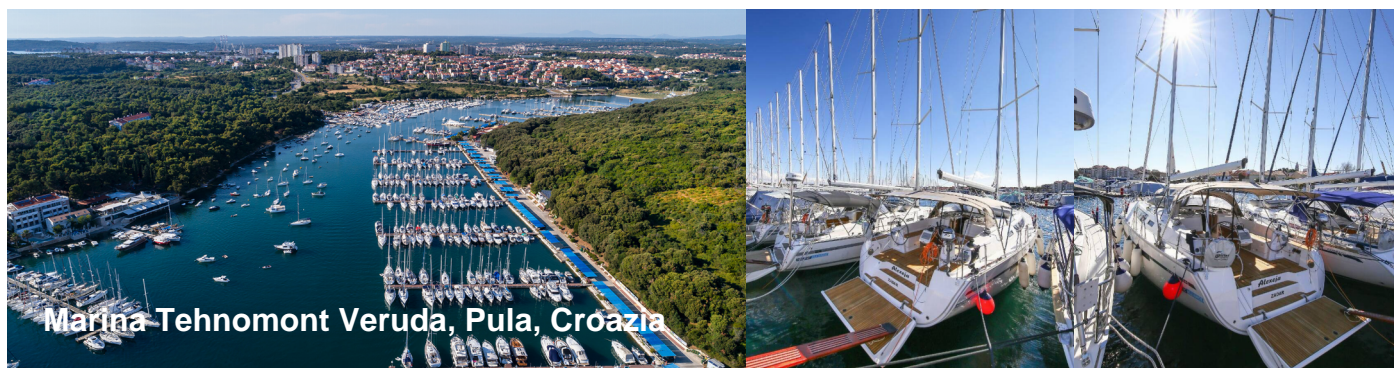
Marina Tehnomont Veruda, Pula, Croazia