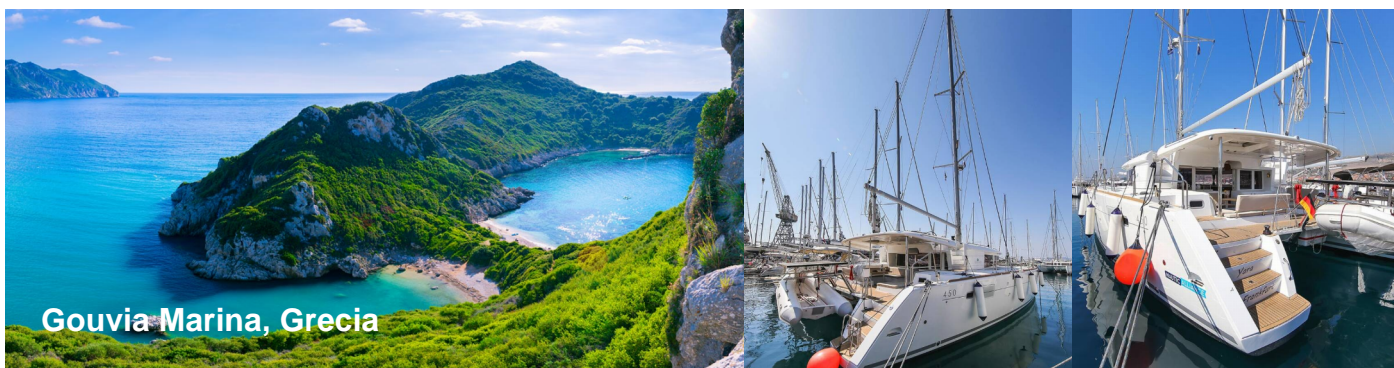
Gouvia Marina, Grecia