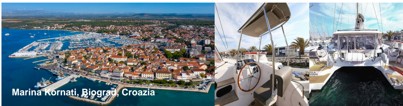
Marina Kornati, Biograd, Croazia