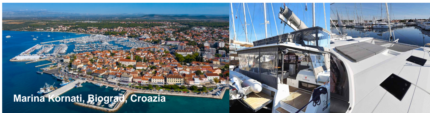
Marina Kornati, Biograd, Croazia