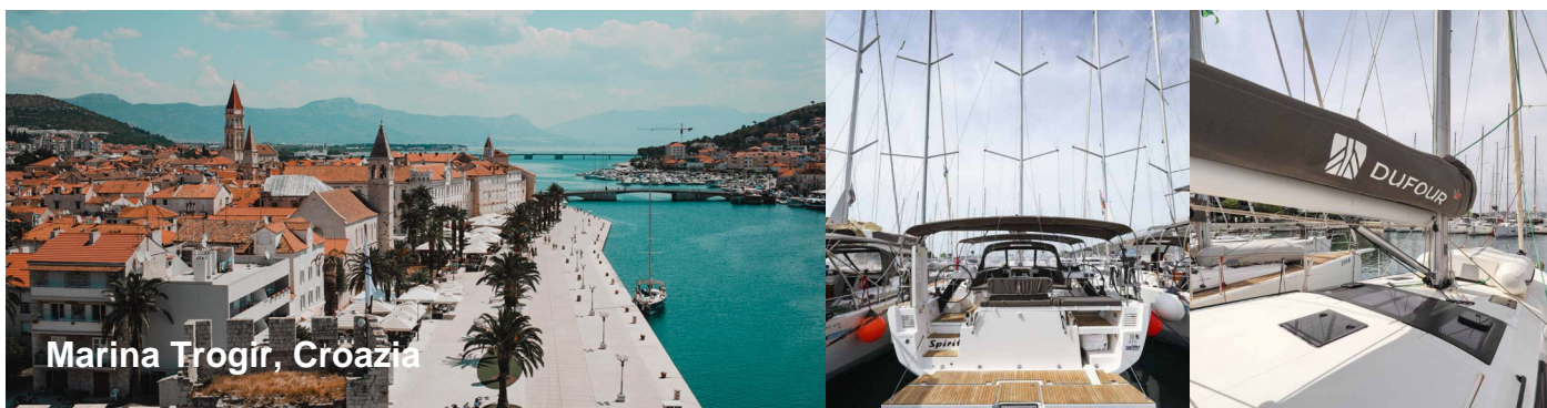
Marina Trogir, Croazia