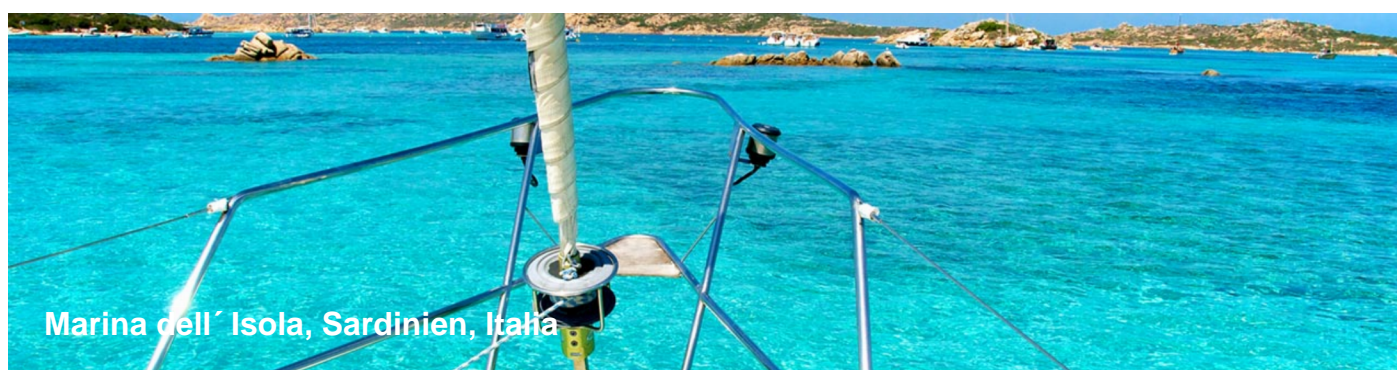
Marina dell'Isola, Sardinien, Italia