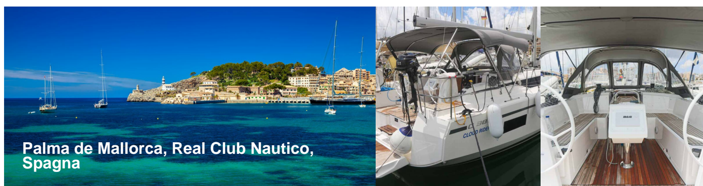
Palma de Mallorca, Real Club Nautico, Spagna