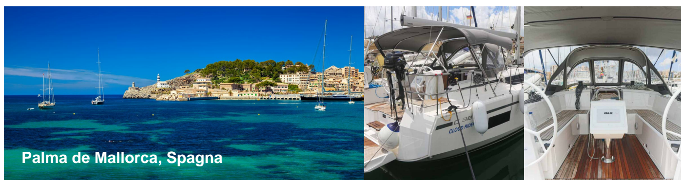
Palma de Mallorca, Spagna