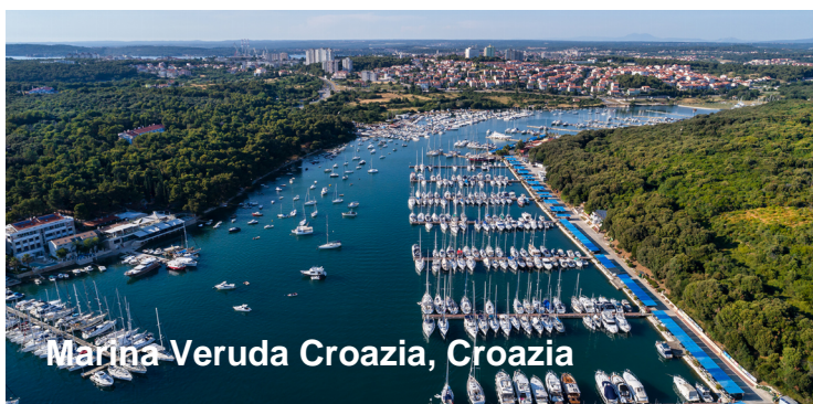
Marina Veruda Croazia, Croazia