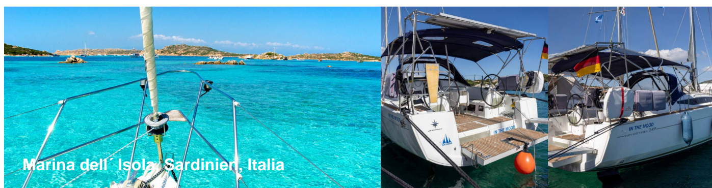
Marina dell' Isola Sardinien, Italia