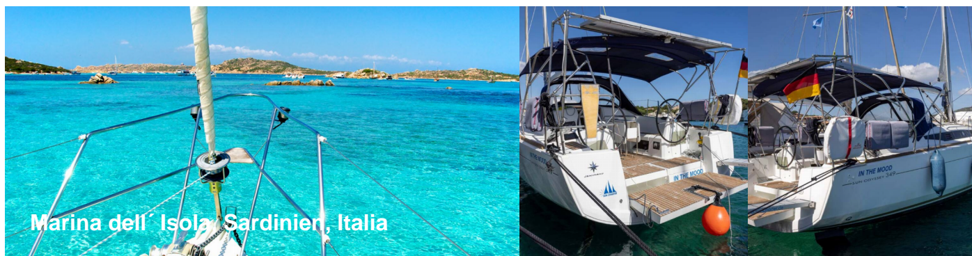
Marina dell' Isola Sardinien, Italia