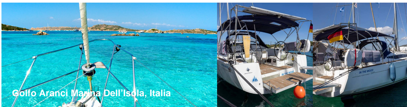
Golfo Aranci Marina Dell'Isola, Italia