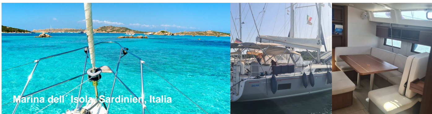
Marina dell' Isola Sardinien, Italia