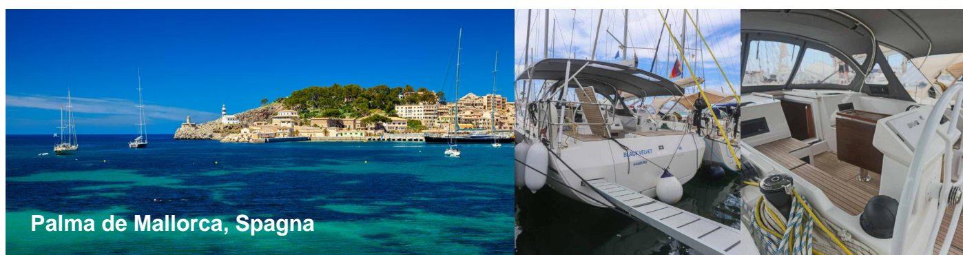
Palma de Mallorca, Spagna