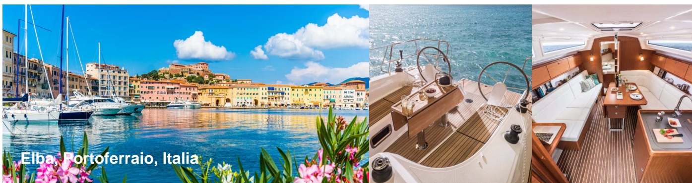
Elba, Portoferraio, Italia