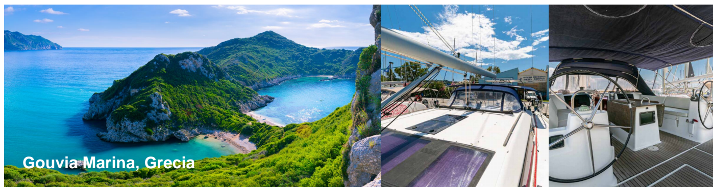
Gouvia Marina, Grecia