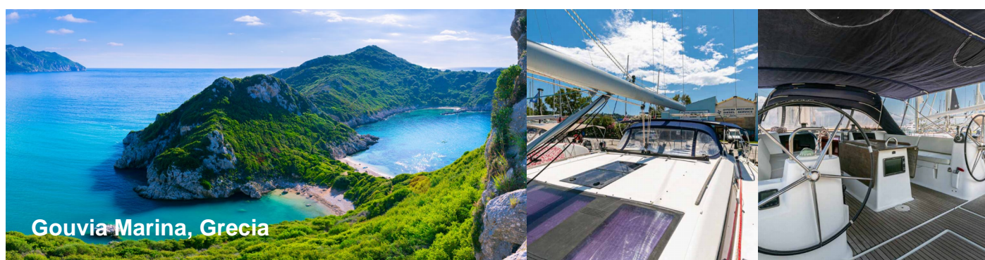
Gouvia Marina, Grecia