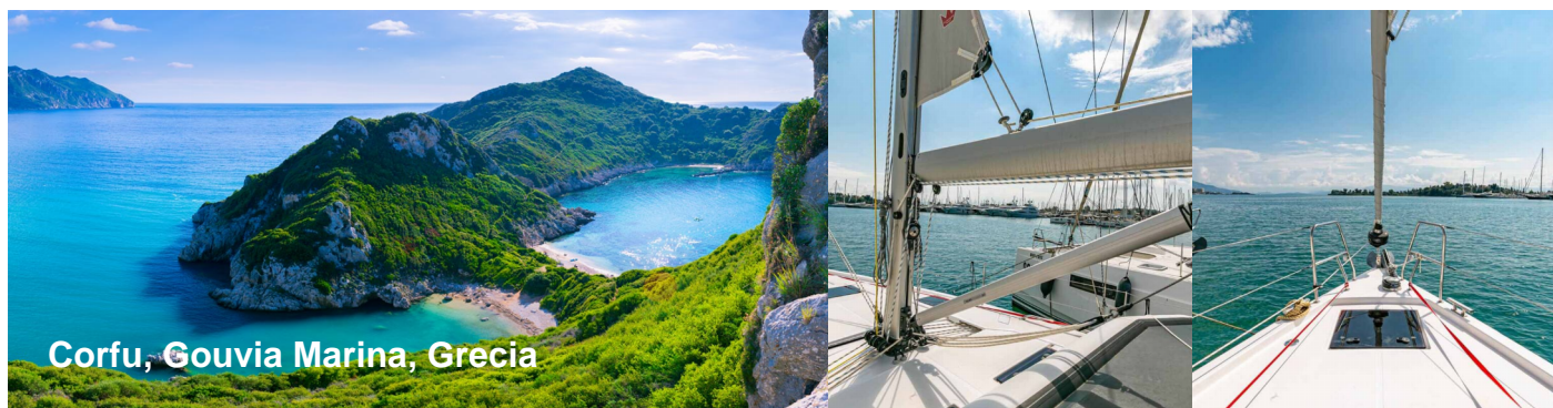
Corfu, Gouvia Marina, Grecia