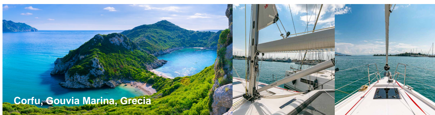
Corfu, Gouvia Marina, Grecia