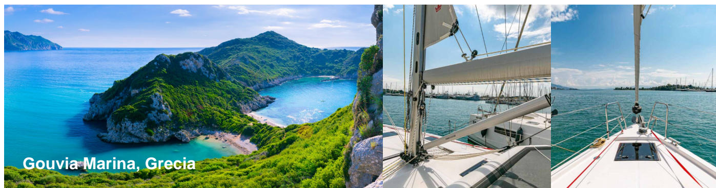
Gouvia Marina, Grecia