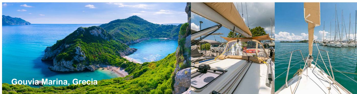
Gouvia Marina, Grecia