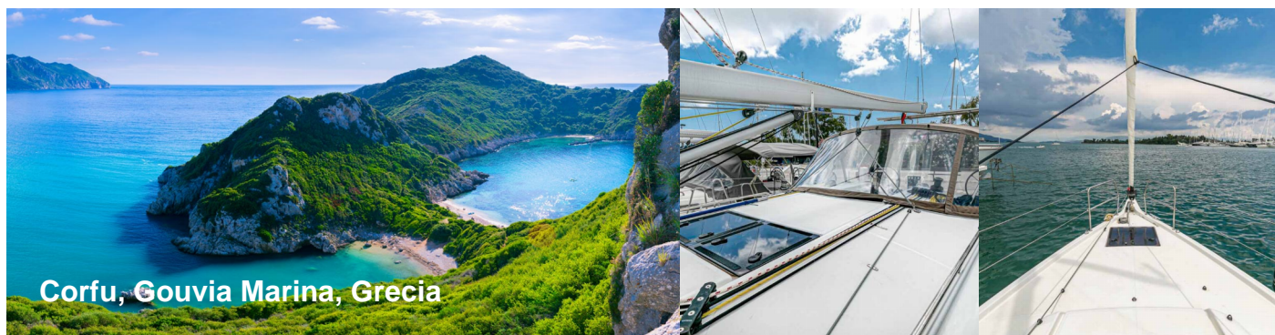
Corfu, Gouvia Marina, Grecia