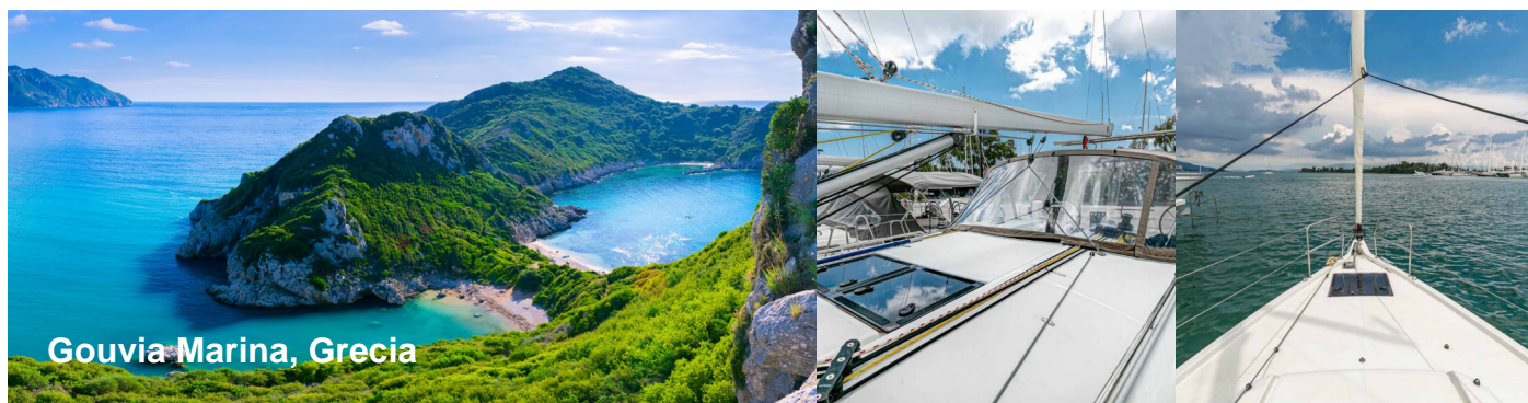
Gouvia Marina, Grecia