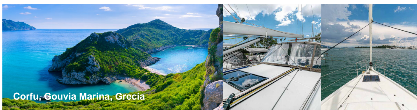
Corfu, Gouvia Marina, Grecia