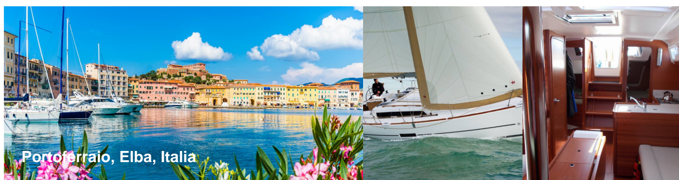
Portoferraio, Elba, Italia