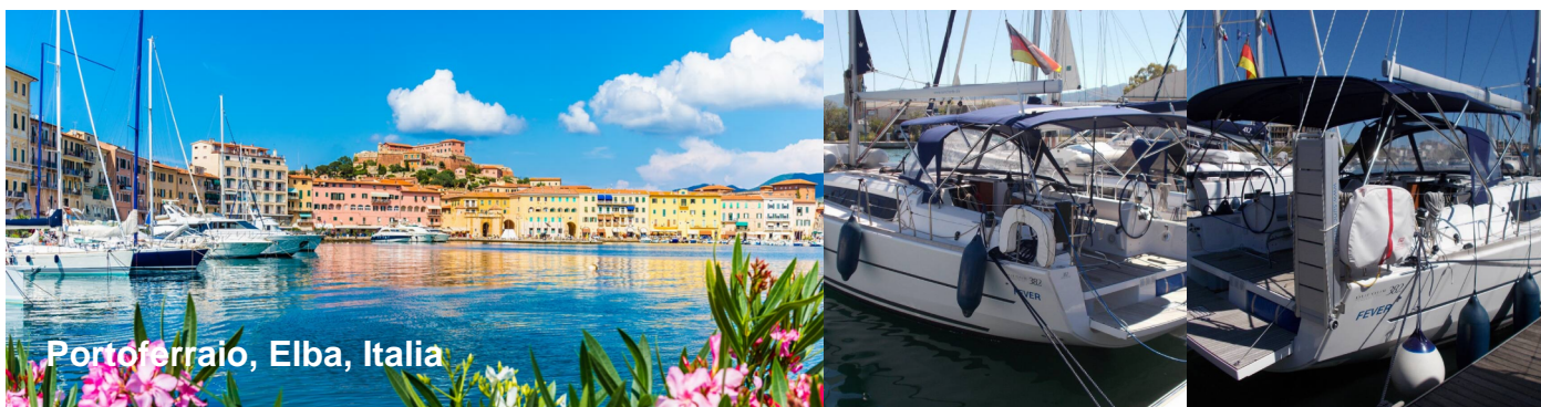
Portoferraio, Elba, Italia