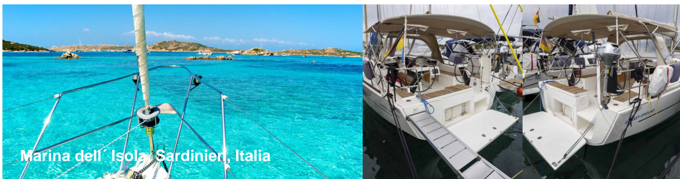
Marina dell' Isola Sardinien, Italia