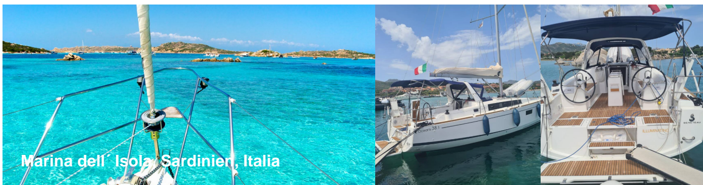
Marina dell' Isola Sardinien, Italia