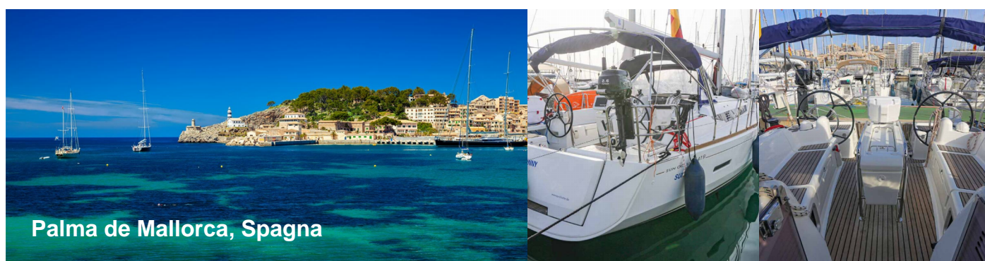
Palma de Mallorca, Spagna