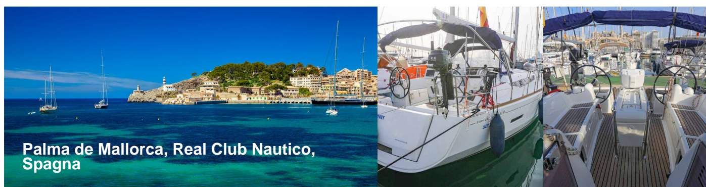
Palma de Mallorca, Real Club Nautico, Spagna