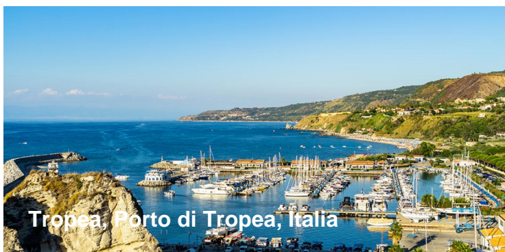
Tropea, Porto di Tropea, Italia