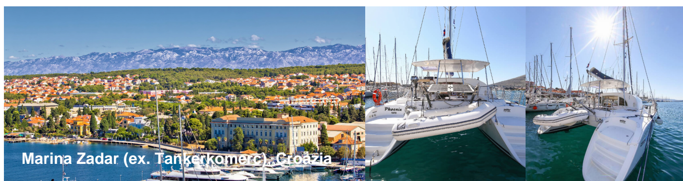
Marina Zadar (ex. Tanjerkomerč), Croazia