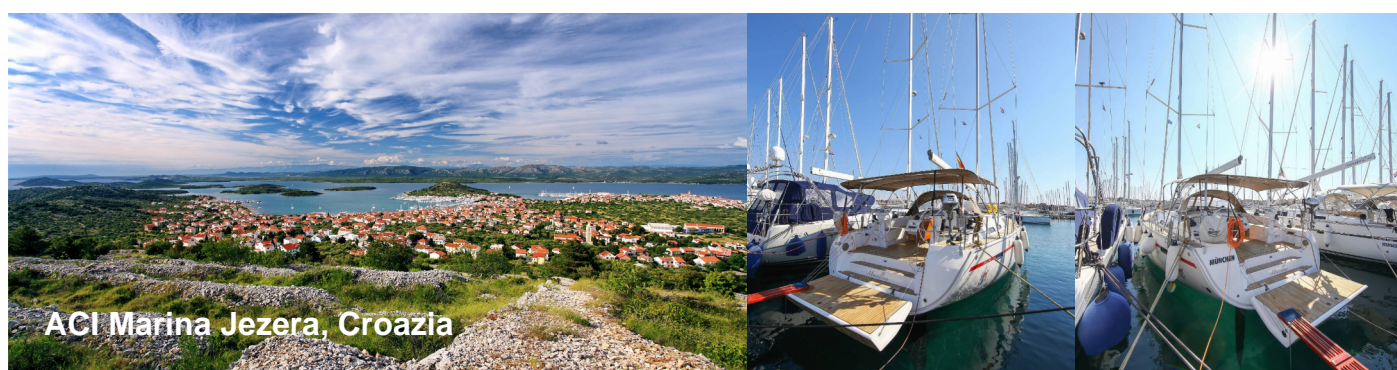
ACI Marina Jezera, Croazia