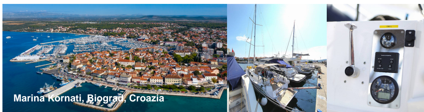
Marina Kornati, Biograd, Croazia