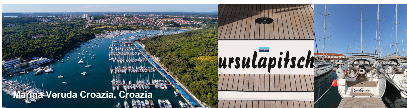
Marina Veruda Croazia, Croazia