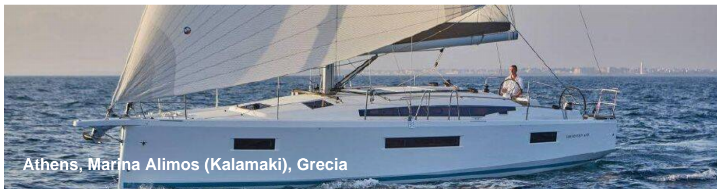
Athens, Marina Alimos (Kalamaki), Grecia