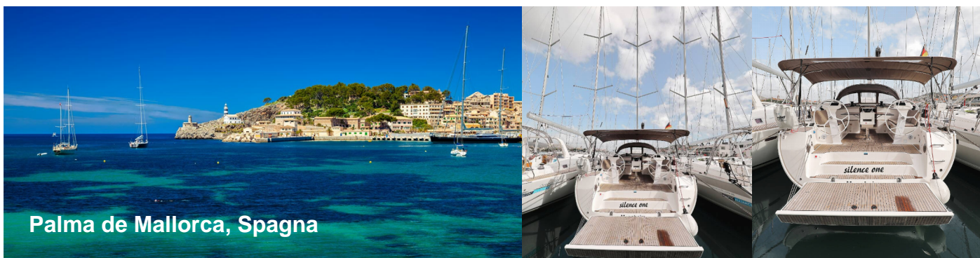
Palma de Mallorca, Spagna