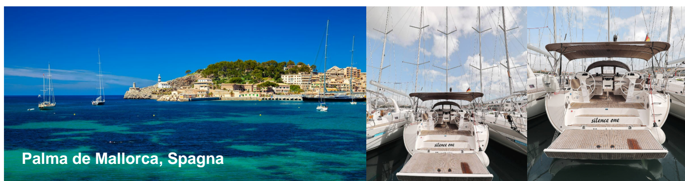
Palma de Mallorca, Spagna