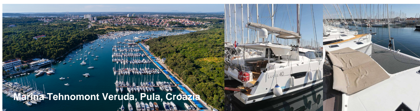
Marina Tehnomont Veruda, Pula, Croazia